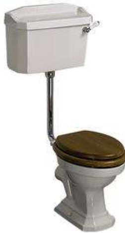
Vista modelo C