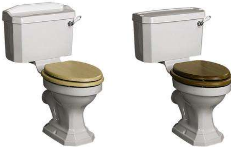
Vista modelos A y B